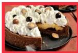
Le Kara aux poires williams