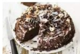
Gâteau de Pâques au...