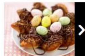
Nid de Pâques aux...