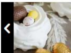
Nids de Pâques au chocolat...

© François DOUCET, confiseur en Provence